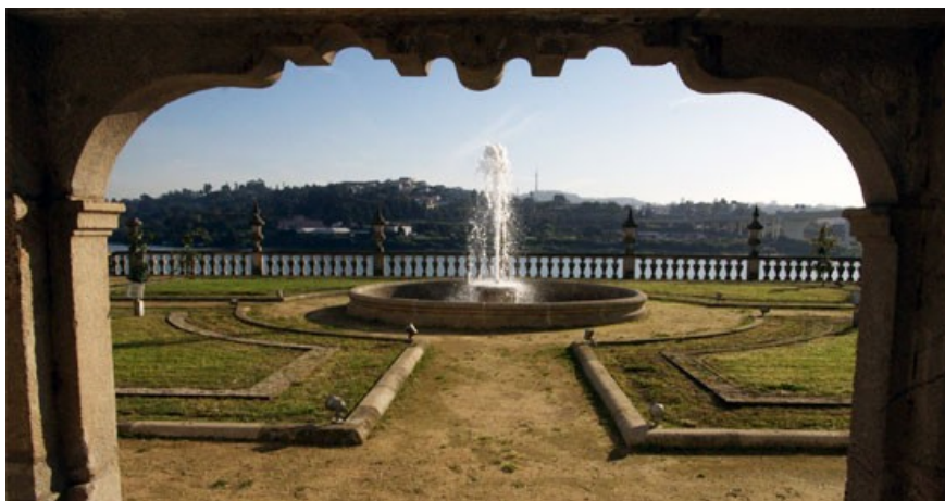
Cortile del Palazzo con visuale sul fiume Douro.