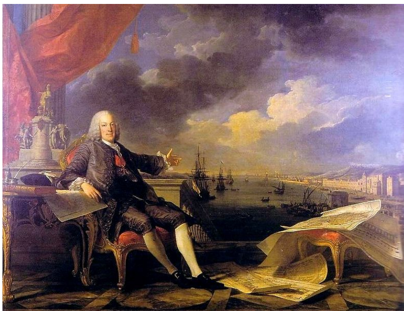
Sebastião José de Carvalho e Melo, Marchese di Pombal, in un ritratto del pittore Louis-Michel van Loo