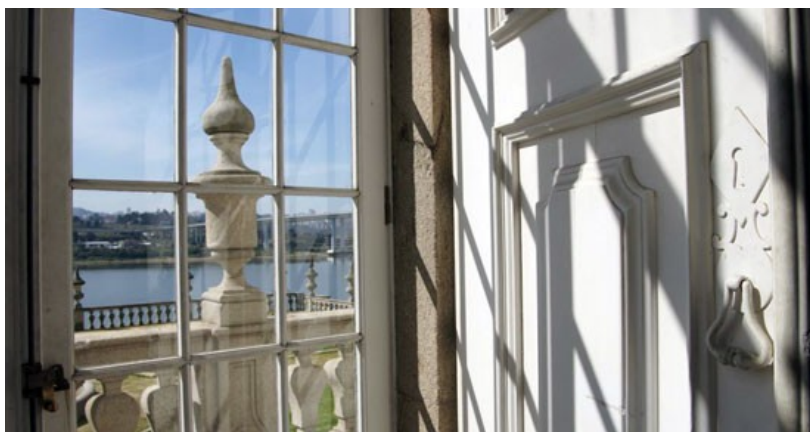
Vista da una delle sale del Palazzo Freixo.