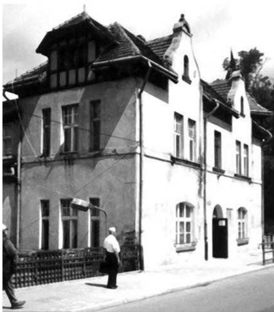
Cinquantadue anni dopo, mio padre davanti alla casa di Hospitalstrasse. Neurode, agosto 1997