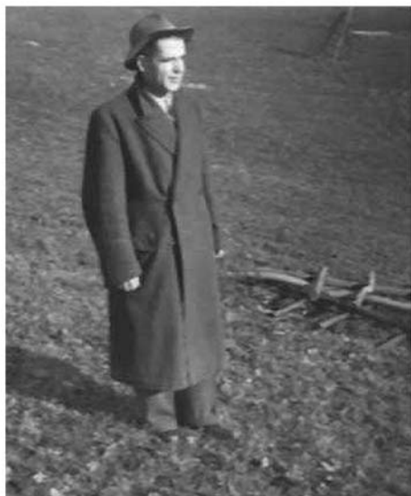
Mio padre nel lager Neurode, autunno 1944