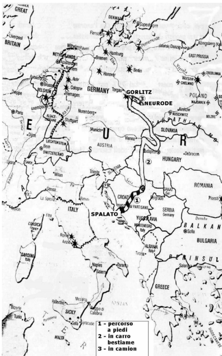
Una probabile ricostruzione del viaggio da Spalato a Neurode