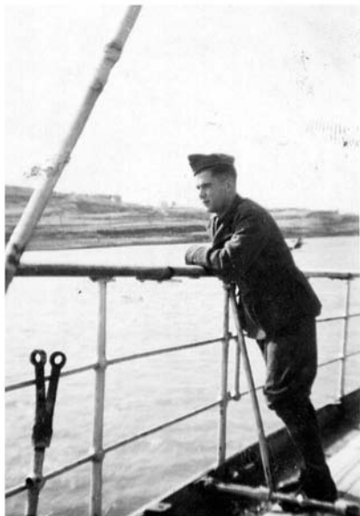
Mio padre durante la libera uscita. Spalato, 1942