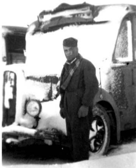
Mio padre davanti al suo automezzo. Croazia, inverno 1942