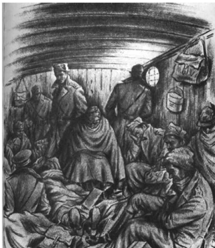
Il carro bestiame