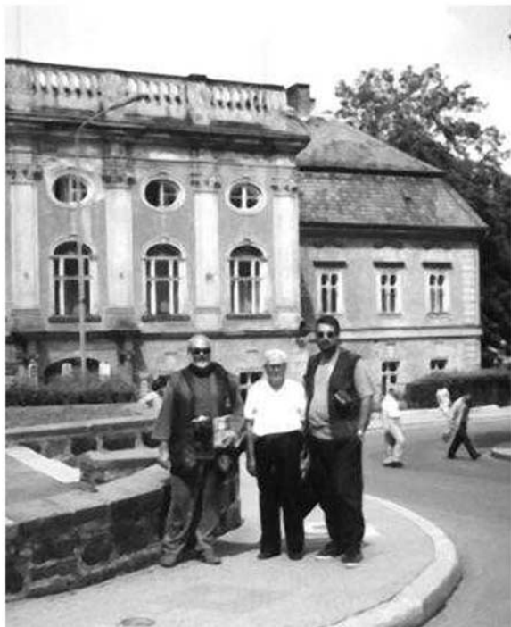
Cinquantadue anni dopo, mio padre, mio fratello ed io davanti all'ex ufficio della Neurode Kolhen. Neurode, agosto 1997