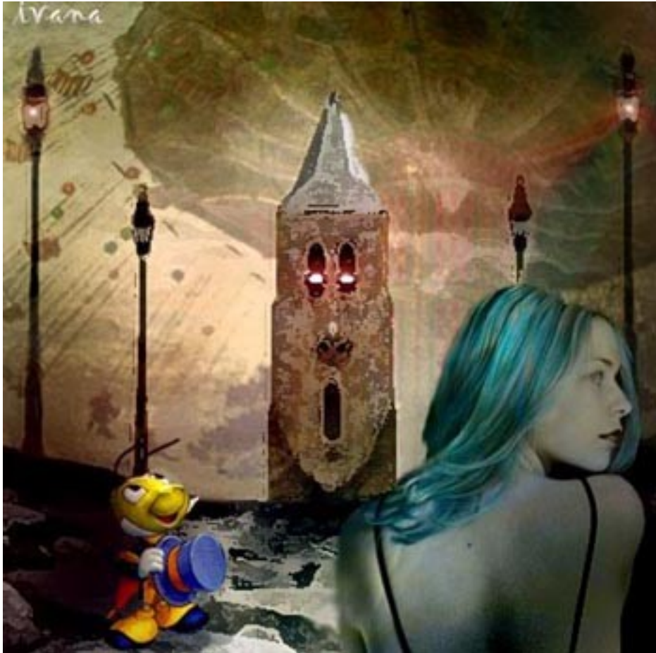
La vera storia di PINOCCHIO scemeggiata da Dafank